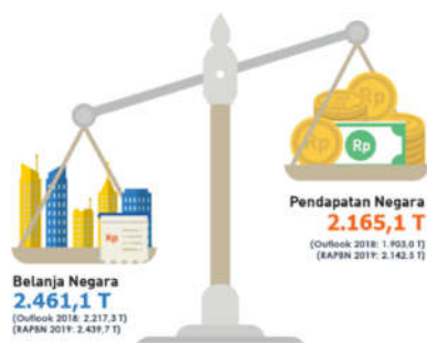
Gambar 1. Postur Anggaran APBN 2019

Menurunnya penerimaan pajak terhadap tingkat kepatuhan wajib pajak dalam melaporkan SPT tahunan di tahun 2019 menjadi alasan peneliti untuk melakukan penelitian kembali terkait dengan pengaruh penerapan sistem E-Filing Wajib Pajak Orang Pribadi.