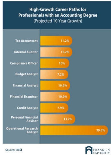
Gambar 2 High Growth Career Path for Professional with an Accounting Degree