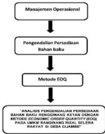
Gambar 2.2 Kerangka Pemikiran