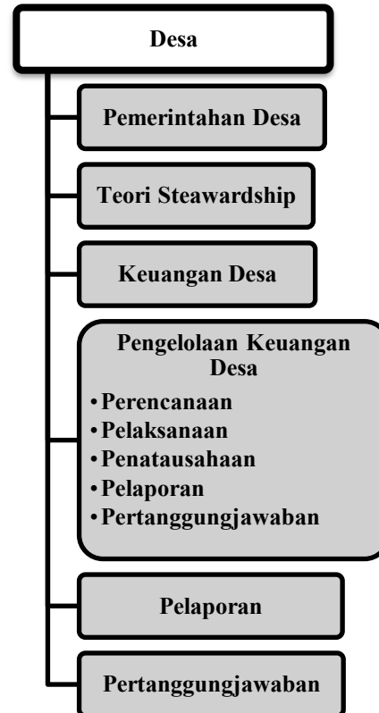
Gambar 2.1 Kerangka Pemikiran

(APB Desa) ini tentunya Kepala Desa beserta BPD dalam menyusun rencana anggaran tidak akan terfokus pada tujuan individu akan tetapi lebih memfokuskan terhadap kepentingan masyarakat desa dan desa nya sendiri.