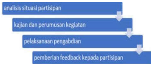
Gambar 1: Proses Pelaksanaan Kegiatan Pengabdian Kepada Masyarakat