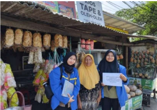
Gambar 4: Akhir Kegiatan PKM bersama beberapa UMKM Kios Tape dan Pusat Oleh-oleh di Jalan Otto Iskandardinata