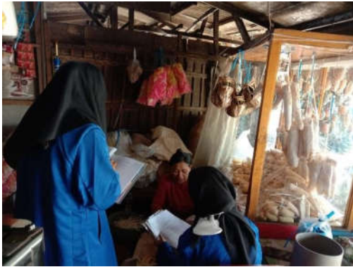
Gambar 3: Sesi Sharing Knowledge bersama beberapa pemilik UMKM Kios Tape dan Pusat Oleh-oleh di Jalan Otto Iskandardinata

Setelah melakukan kajian dan perumusan kegiatan, dilakukan sosialisasi dan edukasi mengenai beberapa aspek literasi akuntansi. Pertama , pelaporan keuangan sangat penting dilakukan untuk meningkatkan bisnis pelaku UMKM. Hal tersebut dikarenakan laporan keuangan sangat membantu pada saat pengambilan keputusan bisnis, pengelolaan risiko, pemantauan kinerja, dan pengembangan strategi bisnis.