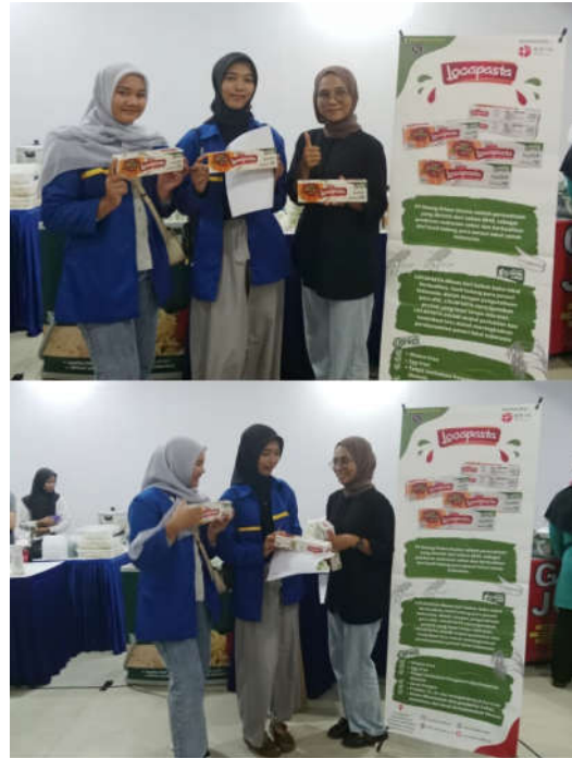
Gambar 4 Berbagai Pengetahuan dan Edukasi Pajak kepada UMKM Loka Pasta

harus memenuhi kriteria PKP dan mengajukan permohonan ke kantor pajak terdekat dengan membawa dokumen-dokumen yang diperlukan.