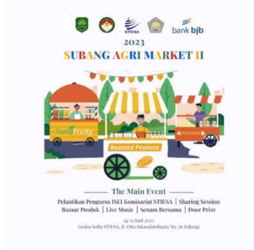
Gambar 2: Subang Agri Market II

Pada bulan Juni 2023, diadakan kegiatan Subang Agri Market yang diselenggarakan oleh Yayasan Sutaatmadja (lihat Gambar 2). Acara ini bertujuan untuk mengumpulkan para pengusaha skala Mikro, Kecil, dan Menengah yang bergerak di bidang Pertanian. Kegiatan pengabdian kepada masyarakat ini dilakukan pada mitra UMKM Loca Food. Loca Food didirikan pada tahun 2019 dan memiliki badan hukum Perseroan Terbatas (PT) pada tahun 2022. Entitas bisnis ini menghasilkan produk lokal hasil para petani di Indonesia yang terbuat dari gluten (gandum), produk ini dibuat dari gluten (gandum) sebagai bentuk rasa peduli untuk pemenuhan kebutuhan. Salah satunya kepada orang yang berkebutuhan khusus dan penderita seliak. Produk ini merupakan kolaborasi dari penelitian dan riset, sehingga produknya sudah terpercaya dan teruji secara konsepnya dan dikolaborasikan dengan hasil dari petani serta mengangkat masyarakat agar bisa mendapatkan penghasilan.