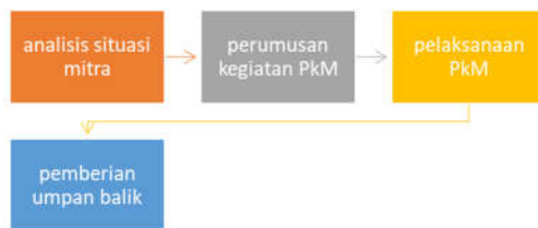
Gambar 3 Proses Pelaksanaan PkM

Literasi pajak UMKM diukur dengan memperhatikan beberapa indikator, yaitu: (1) Pemahaman mengenai Nomor Pokok Wajib Pajak (NPWP), Nomor Pokok Pengusaha Kena Pajak dan prosedur pembuatannya, (2) Penghitungan pajak khusus untuk UMKM terutama pajak penghasilan (PPh) dan pajak pertambahan nilai (PPN), dan (3) Pembukuan sederhana. Indikator ini mengacu pada kerangka kerja yang telah diusulkan oleh beberapa penelitian terkait (Agusti & Rahman, 2023; Arifin & Sriyono, 2022; Maswin et al., 2023; Naitili et al., 2022).