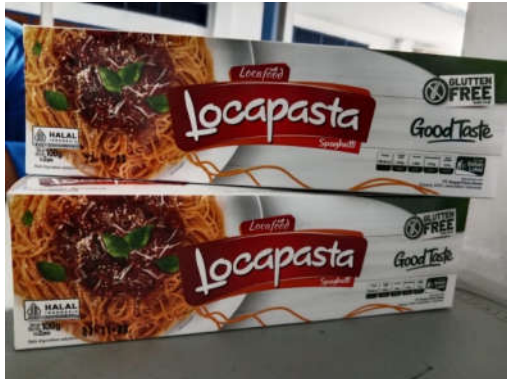
Gambar 4 Produk UMKM Loca Food

Analisis situasi mitra menunjukkan beberapa hal sebagai berikut: pertama , menghadapi kendala keuangan terkait sistem administrasi yang belum optimal dan kendala pencatatan keuangan. Dalam mengatasi kendala keuangan tersebut pengelola akan menggunakan aplikasi berbayar agar memudahkan dalam menginput data sehingga laporan keuangan sudah tersedia secara otomatis.